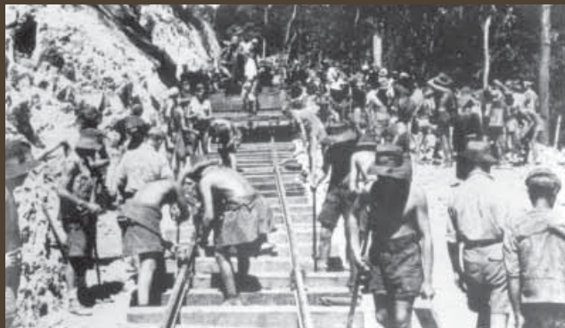
เชลยศึกทำงานบนทางรถไฟสายไทย-พม่า

จากเชลยศึกฝ่ายพันธมิตร 60,000 คน ที่สร้างทางรถไฟ