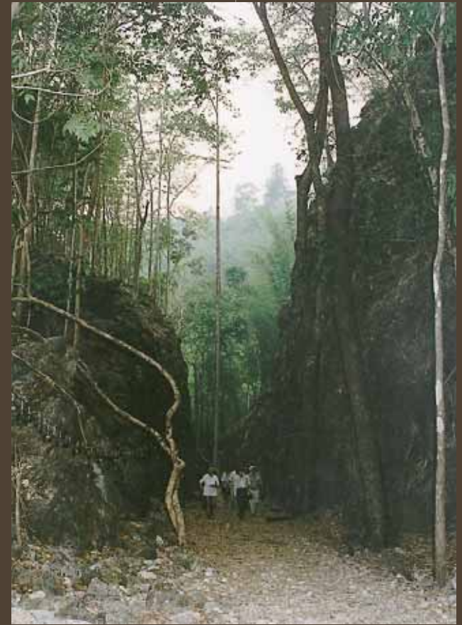
ช่องเขาไฟนรก (ช่องเขาขาด)

ประเทศไทยเป็นพันธมิตรกับญี่ปุ่นโดยไม่สมัครใจ ดังนั้นชาวต่างชาติฝ่ายพันธมิตรที่อยู่ในประเทศไทยจึงได้รับการปฏิบัติอย่างดีจากคนไทย ซึ่งชาวต่างชาติที่อยู่ในประเทศไทยเหล่านั้นมีความห่วงใยต่อความเป็นอยู่ของเชลยศึก จึงได้จัดตั้งองค์กร “วี” (V) ขึ้นมาโดยได้รับการสนับสนุนจากนักธุรกิจที่เป็นกลาง รวมทั้งคนไทยที่เข้าใจต่อสถานการณ์ในขณะนั้น ซึ่งองค์กรวีได้แอบจัดส่งยาและอาหารแก่เชลยศึก